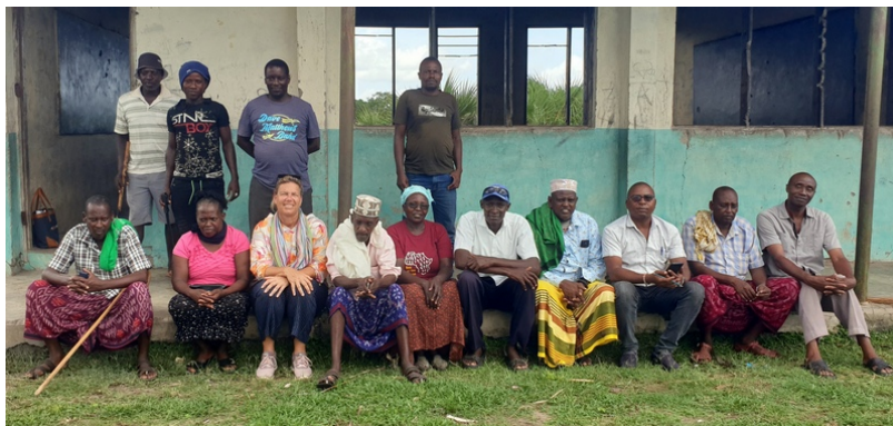
Finanzierungszusage unseres Kipungani-Vereins für ein neues Klassenzimmer. Und auch hier startet der Bau sofort nachdem alle Formalien erfüllt sind.