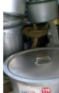
Motivation gibt es neue Töpfe und die Reparatur des Energiesparherdes.

Weiter nach Mandani Primary, einer Kleinstschule bei den Wadai, einem Viehzüchter-Stamm. Nach längeren Verhandlungen über die Höhe und Art der Eigenbeteiligung gibt es auch hier eine